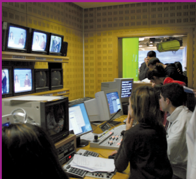
Facultad de Humanidades, Comunicación y Documentación. UC3M.

televisión-cine: memoria, representación e industria