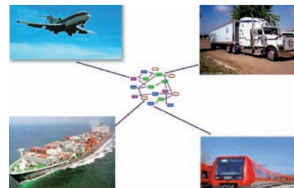
Logística: Planificación de procesos de logística.