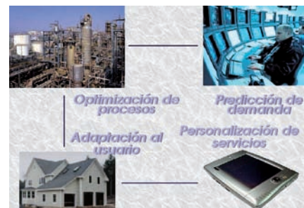
Industria: Predicción y planificación de secuencias de control en procesos industriales