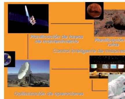
Espacio: Planificación de misiones espaciales