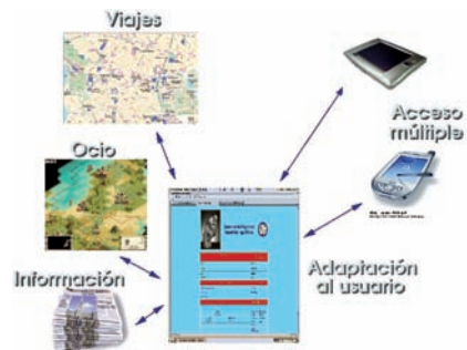
Personalización: Construcción de herramientas de personalización automática