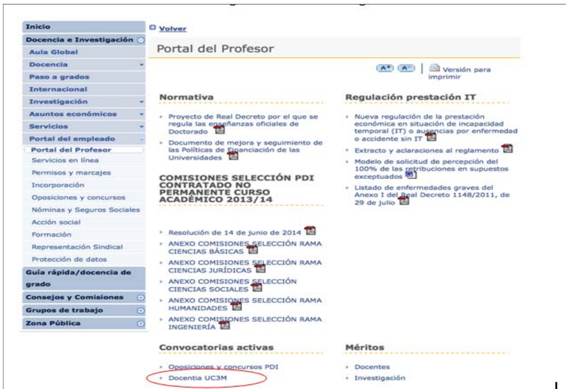
Imagen I: Web del Portal de Profesor. Servicio de RRHH

El diseño del modelo DOCENTIA-UC3M e informes de certificación y de la implantación se encuentran disponibles para toda la comunidad universitaria en el servicio de RRHH de la universidad (Imagen I) que es directamente accesible por el colectivo afectado. También se accede a través de la web de calidad en una página propia de la convocatoria DOCENTIA UC3M (Imagen II).