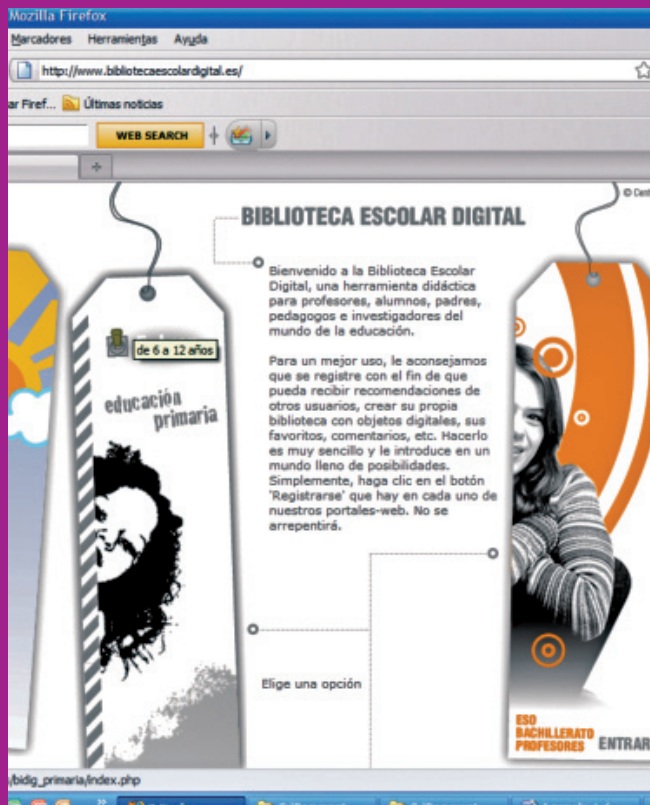
Biblioteca Escolar Digital del Centro Internacional de Tecnologías Avanzadas de la Fundación Germán Sánchez Ruipérez. Disponible en: http://www.bibliotecaescolardigital.es/