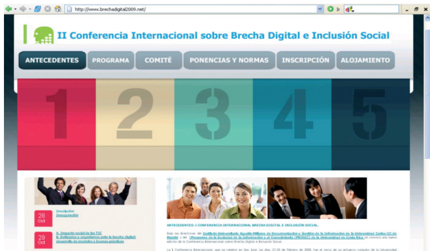
Conferencia Internacional sobre Brecha Digital. Disponible en: http://www.brechadigital2009.net/