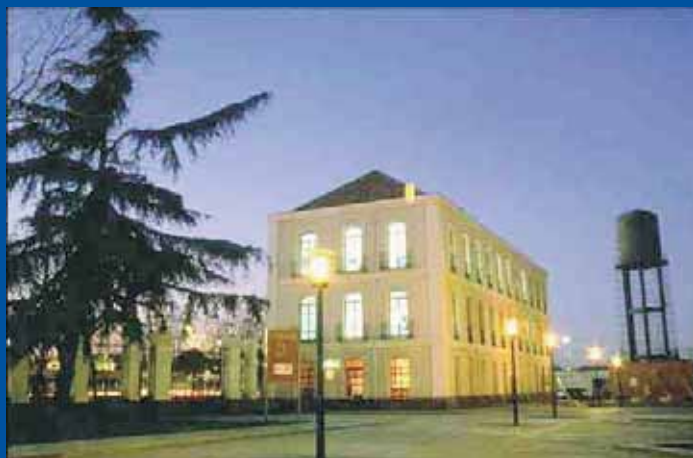
Decanato Universidad Carlos III de Madrid