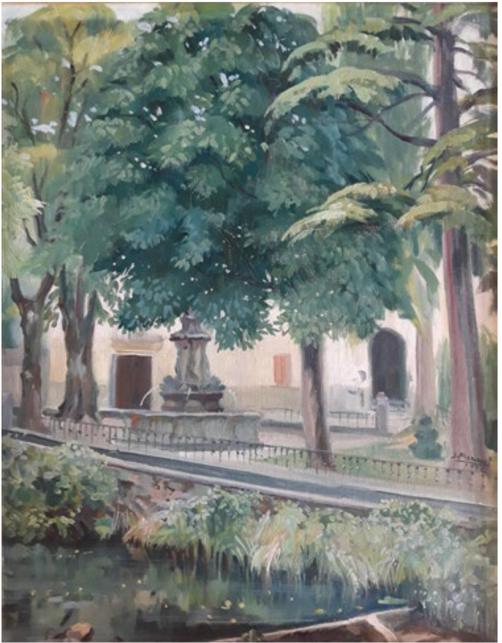
«Pinondo» Olea mihise gainean / Óleo sobre lienzo