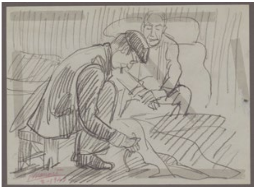
«Uno que hace algo y otro que mira» Ikatz-ziria / Carboncillo