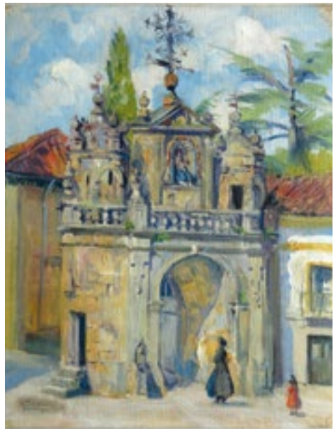
«Arco de Santa Ana» Oleoa mihise gainean Óleo sobre lienzo