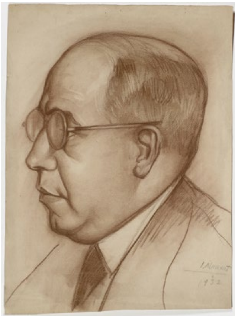
«Manuel Azaña» Sangina / Sanguina