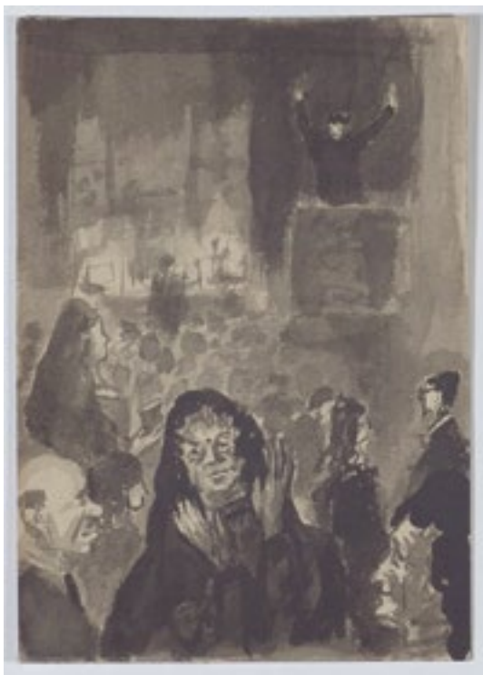
«Misa en Durango» Aquarela / Acuarela