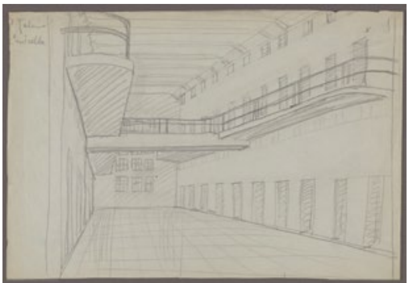
«Séptima galería, mi celda» Ikatz-ziria / Carboncillo