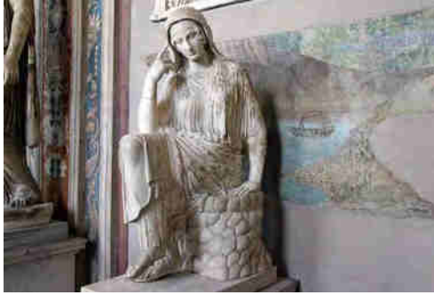
Fig. 1: Estatua de Penélope. Copia romana de época imperial de un prototipo del 460 a.C., expuesta en los Museos Vaticanos.

entre pensativa y ensimismada, en una posición y una actitud que reflejan sin paliativos su inmensa tristeza, su añoranza y su nostalgia, inmersa en una pena tal que parece mantenerla ajena al mundo que la rodea, incluso al descalabro que los famosos pretendientes están causando en su hacienda, quizás como reflejo de la opinión de su hijo Telémaco, que llegado a cierta edad se desespera ante la impasibilidad de su madre, según se desprende del diálogo mantenido con la diosa Atenea, ésta bajo la figura de un huésped, quien le pregunta “¿ Qué festín se da aquí?... ¿Es convite o banquete de bodas? ” ( Od. I, 223-226 ) y le anima a partir en busca de noticias sobre su padre para intentar poner fin a la delicada situación vivida en Ítaca.