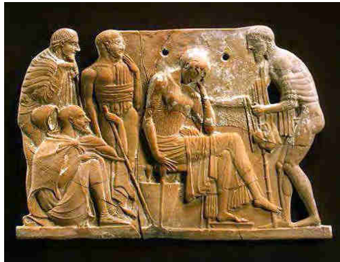
Fig. 4: Relieve de Melos, de mediados del s. V a.C.

Esta escena fue representada en varios relieves de terracota hallados en la isla de Melos (Hausmann, 1994: 33, a,b,c; Parisi, 1996: 386-387, fig. 6), que datan de mediados del siglo V a.C., según diversas variantes, en ocasiones con algunos acompañantes (Fig. 4), a pesar de que en la Odisea aquel encuentro se produce a solas 6 . No obstante, en todos