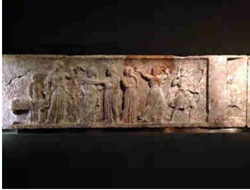
Fig. 3: Relieve del primer cuarto del siglo IV a.C. conservado en el Kunsthistorisches Museum de Viena.

Tras el citado ardid del arco - planteado por Penélope que se documenta en un relieve del primer cuarto del siglo IV a.C. (Fig. 3) conservado en el Kunsthistorisches Museum de Viena (Hausmann, 1994: 30), donde ella figura a la izquierda - y culminada la matanza de los pretendientes, llegaría el ansiado reencuentro de Penélope y Odiseo. Por fin la nodriza Euriclea podría revelar a su ama la llegada de su esposo, si bien Penélope creyó en un principio que eran imaginaciones de la anciana. A pesar de los detalles referidos por la nodriza, como aquella cicatriz en la pierna que le había causado un jabalí durante una jornada cinegética, el relato del encuentro ( Od. XXIII, 96-110) resulta sorprendente en alguien que, como amantísima esposa, lleva añorando y aguardando veinte años! Sin abrazos, ni muestra alguna de efusividad, ni expresión de amor y felicidad ante la escena mil veces deseada e imaginada...hasta el punto de que Telémaco recriminará a su madre la frialdad - pues tienes el alma tan dura! , le dice, y qué otra renunciara, oprimiendo su alma, a acercarse a un esposo...Corazón como peña de duro se alberga en tu pecho ". A lo que Penélope, justificándose responde " Tan suspensa, hijo mío, he quedado... ".