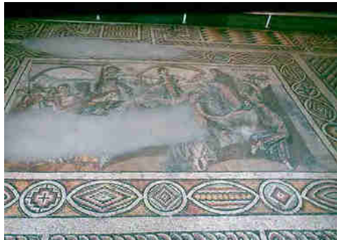
Fig. 5: Mosaico de Apamea del s. IV d.C. Musée des Beaux Arts.

El emotivo encuentro está representado en un magnífico pavimento romano de Apamea (Siria) (Fig. 5) que se conserva en el Museo de Beaux-Arts de Bruselas (Balty, 1972: 103-106) donde Odiseo, con la apariencia propia de un vagabundo errante, la del mendigo extranjero, y su característico pilos, ha sido captado en el instante de llegar al umbral de entrada de un edificio, sin duda, el palacio de Ítaca, su casa, abrazándose