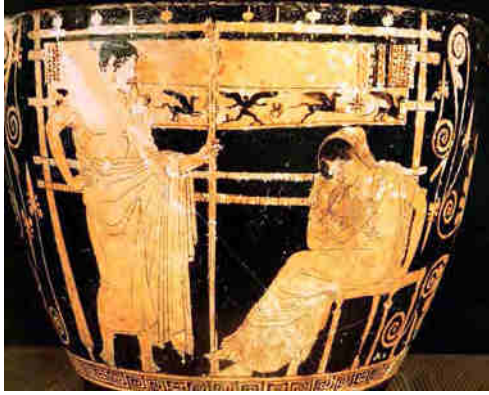
Fig. 2: Penélope y Telémaco. Pintura de un skyphos ático del llamado Pintor de Penélope. Museo Archeologico de Chiusi. Inv.1831.

de pie frente a ella en una actitud que parece pretender llamar la atención de su madre, probablemente para frenar la devastadora acción de los pretendientes. Como se puede apreciar, es de señalar, que aun evocando el pretexto del sudario por tejer, la escena no reproduce de forma literal el pasaje de la Odisea , ya que deja entrever el conocimiento del ardid por parte de Telémaco, cuando en realidad del texto se desprende que aquella estratagema de Penélope fue ideada durante los primeros años de invasión de la hacienda, tras el final de la guerra sin el retorno de Odiseo, según relata el propio Antínoo a Telémaco.