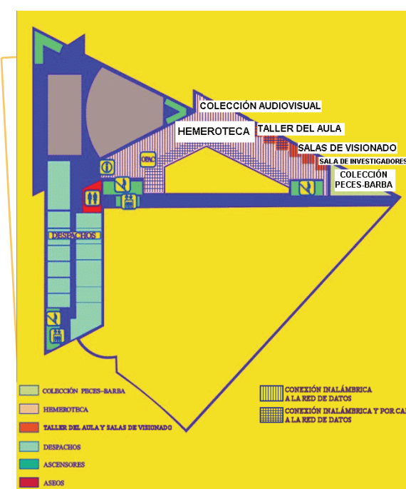
PLANTA PRIMERA (Hemeroteca)