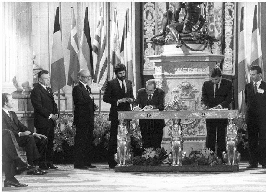
Firma del Tratado de Adhesión de España a la CEE. 12 de junio de 1985.

FUENTE HISTÓRICA: Relacione esta imagen con la integración de España en Europa