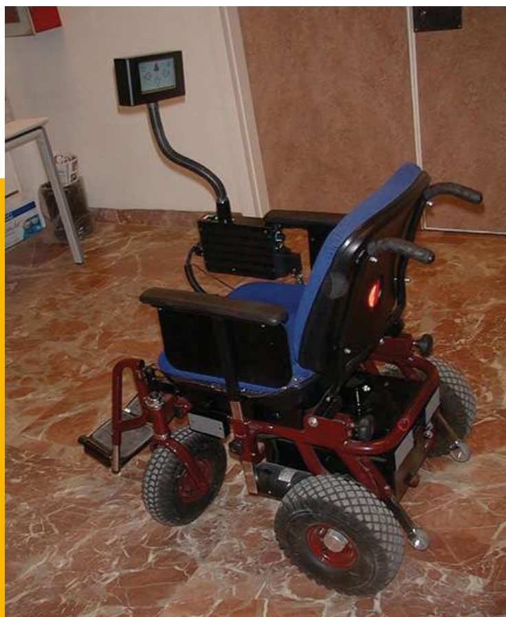
Prototipo de silla de ruedas inteligente para personas con discapacidad motora severa.