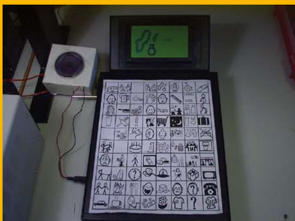
Comunicador programable y con refuerzo de voz basado en los lenguajes BLISS y SPC para personas con discapacidad mental severa.