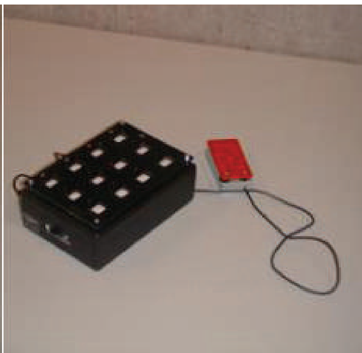
Comunicador programable y con mensajes de voz para personas con discapacidad mental severa actuado por un único pulsador.