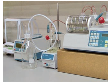
Equipo Karl-Fischer para análisis de humedad en papel aislante de transformadores