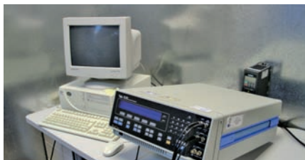
"Medida de Z(\omega) ": Equipo de caracterización de la respuesta dieléctrica de materiales aislantes en el dominio de la frecuencia. Ancho de banda 0,1 \mu Hz a 30 MHz