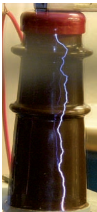
"Contorneo de aislador" y "Contorneo 2": Ensayos de tensión aplicada a un aislador de intemperie

Entre los principales clientes del grupo se encuentran UNIÓN FENOSA DISTRIBUCIÓN, S.A., DIAGNOSTIQA S.A., SANTOS Maquinaria Eléctrica S.L. o CEIS S.L. con quienes mantiene relaciones estrechas y estables.