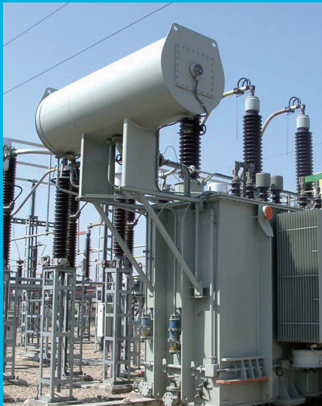
"Transformador de distribución": Desarrollo de sistemas de monitorización en tiempo real y diagnóstico del estado del aislamiento en transformadores de distribución

El Grupo de Diagnóstico de Máquinas Eléctricas y Materiales Aislantes (DIAMAT), liderado por el Dr. Javier Sanz Feito, está formado por un equipo de doce expertos en el desarrollo de técnicas novedosas para la monitorización y diagnóstico de máquinas eléctricas, incluidos transformadores de potencia, el análisis del comportamiento de los materiales aislantes en máquinas y dispositivos eléctricos y la realización de ensayos y medidas en alta tensión y análisis de respuesta dieléctrica (en el dominio de la frecuencia).