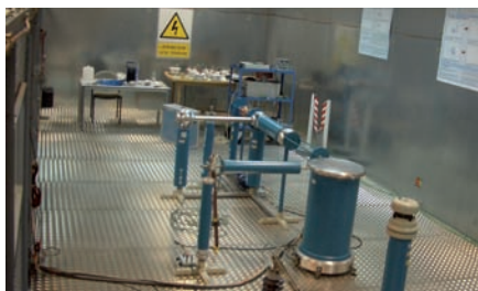
Vista general del Laboratorio de Alta Tensión