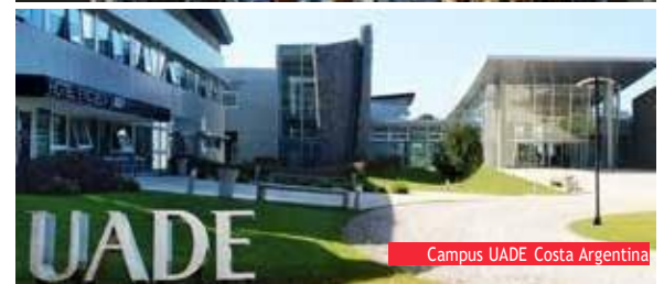
Campus UADE Costa Argentina

Dirección: Lima 757 (C1073AAO) Ciudad: Ciudad Autónoma de Buenos Aires Código postal: C1073AAO Teléfono: (+54-11) 4000-7600 Sitio web: www.uade.edu.ar