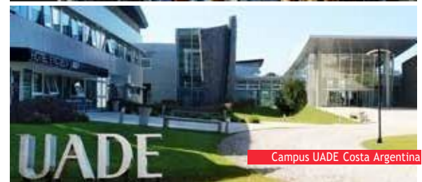
Campus UADE Costa Argentina