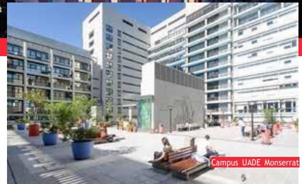
Campus UADE Monserrat