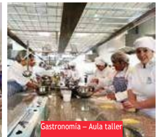
Gastronomía – Aula taller