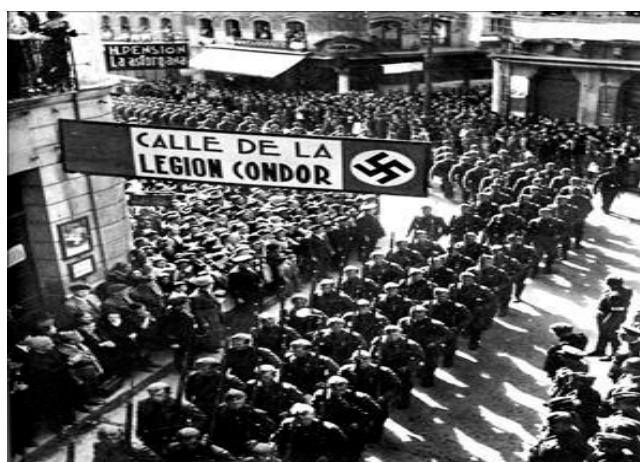
Homenaje de despedida de la FET y de las JONS a la Legión Cóndor en León (1939).

TEMA: El reinado de Isabel II (1833-1868): las desamortizaciones de Mendizábal y Madoz. De la sociedad estamental a la sociedad de clases.