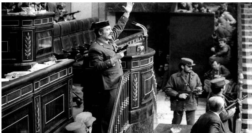
Teniente Coronel Antonio Tejero en el Congreso de los Diputados.