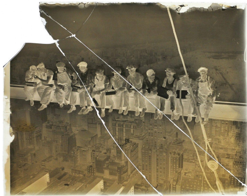
El negativo original de cristal de “Almuerzo en lo alto del rascacielos”.

Realmente, no hay nada casual en la instantánea. Los trabajadores actúan como si almorzaran cada día con las mejores vistas de la ciudad, pero en realidad la imagen fue una puesta en escena para promocionar el desarrollo inmobiliario.