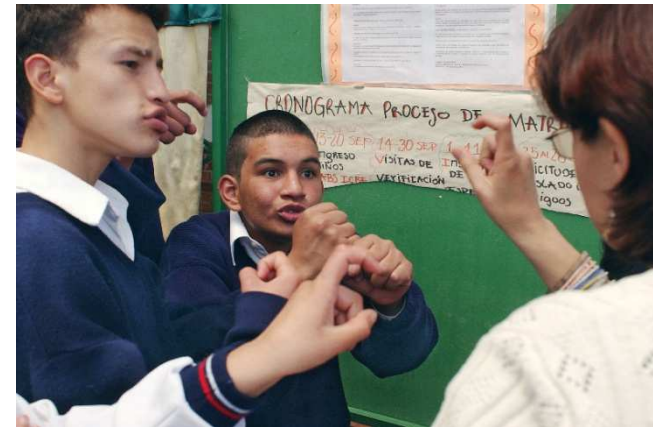
"Los gestos del silencio". V Concurso Fotografía INICO