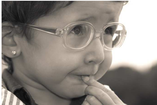
"La mirada de la esperanza". VIII Concurso Fotografía INICO