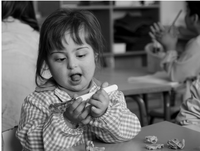
"Yo puedo". VIII Concurso Fotografía INICO

«Capacitar a los niños y niñas para reivindicar el cumplimiento de sus derechos.»