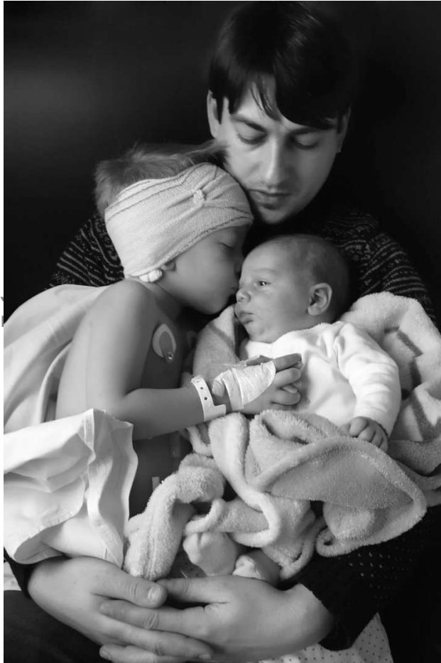
"Podré oírle". VIII Concurso Fotografía INICO