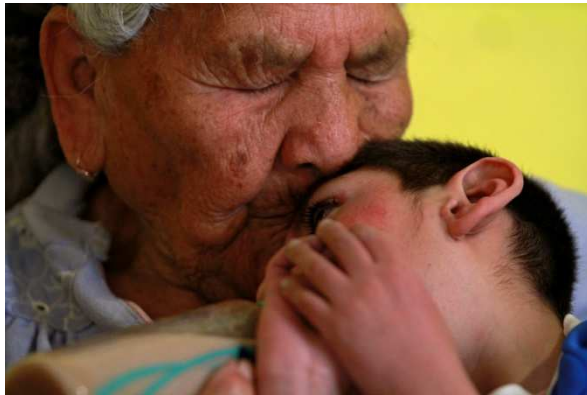
"Noé". Concurso Fotografía INICO