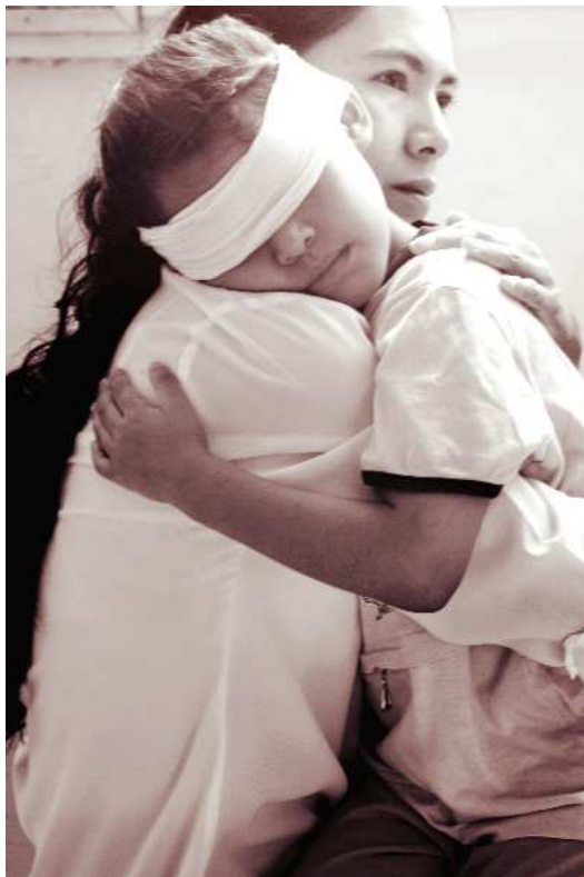
"Apóyate en mí". V Concurso Fotografía INICO