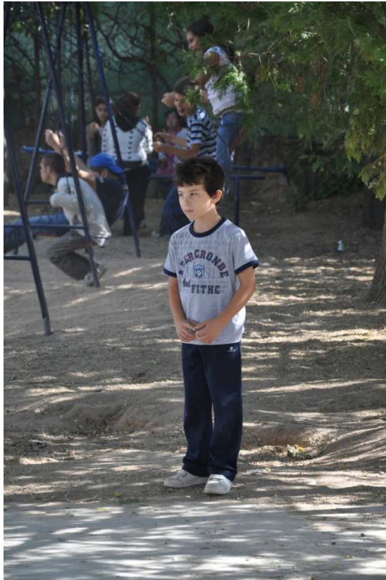
"La discriminación es el principal impedimento de la discapacidad". IX Concurso Fotografía INICO

La participación es un medio para ejercer el derecho a la ciudadanía.