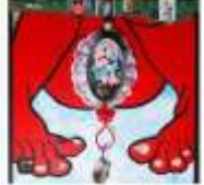
Una manifestación en Madrid.

La cultura que vive en el momento de la historia. La cultura que vive en el momento de la historia. La cultura que vive en el momento de la historia. La cultura que vive en el momento de la historia. La cultura que vive en el momento de la historia.