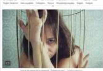
Una manifestación en Madrid.

LUNA NUEVA ARTIST - Madrid | 7 de marzo de 2014 | 12:02