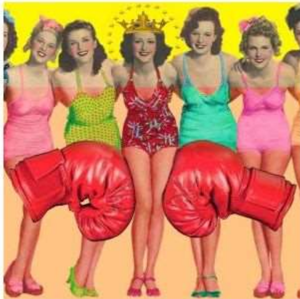
Gracia 20Bondi cc 81a

Condividi 0 Mi piace 0 Tweet 2 Condividi 0