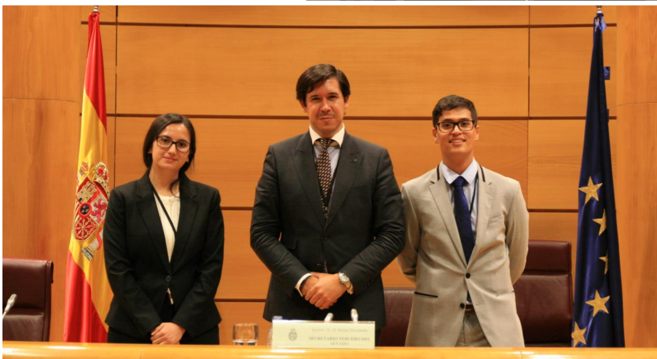
El equipo disfrutó de una buena experiencia de debate en el Senado. En la imagen, en la tribuna de la Cámara Alta