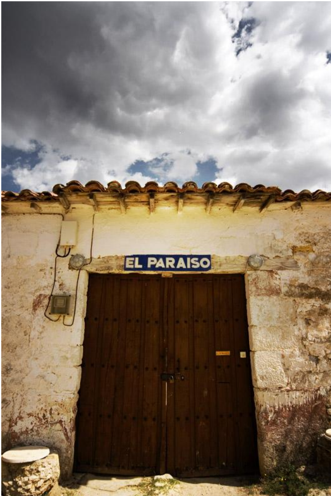
EJERCICIO TERCERO OPCIÓN B "Where the grass is green and the girls are pretty" Carlos Cazorro (2007)