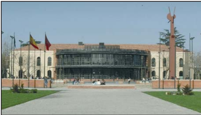
Universidad Carlos III, Campus de Getafe (Madrid) donde se imparte MeDEA