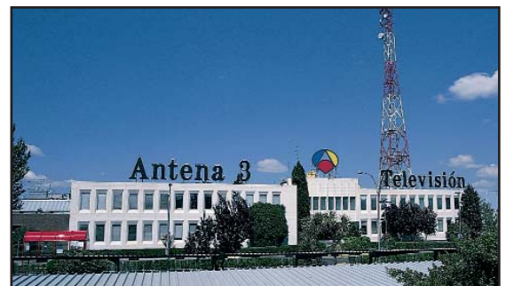
Antena 3 TV colabora con MeDEA desde el principio

R.: Cada alumno viene con un proyecto distinto, para el que quiere que