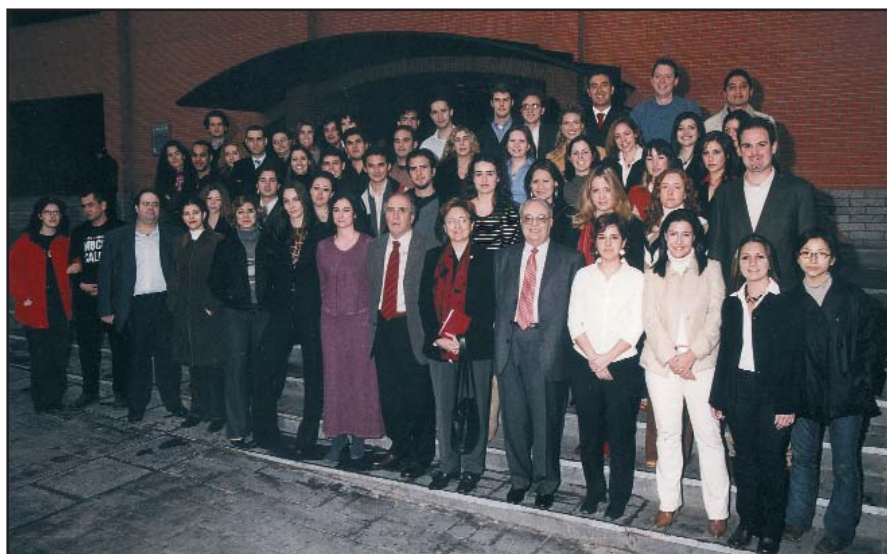
Profesores y alumnos en una reciente graduación de MeDEA

R.: El claustro de profesores es muy numeroso y con personalidades destacadas tanto en el ámbito académico como en el profesional.